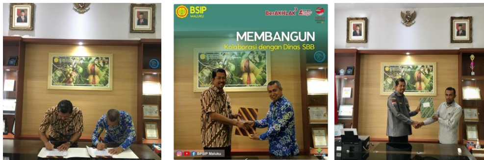
Gambar 4 : Penandatanganan Perjanjian Kerjasama

Balai Penerapan Standar Instrumen Pertanian (BPSIP) Maluku mempunyai tugas dan fungsi serta Visi dan Misi serta untuk menunjang kelancaran tugas itu, Sub Koordinator Kerjasama dan Pelayanan Pengkajian melaksanakan kegiatan manajemen yaitu pengembangan kerjasama melalui Penandatanganan Perjanjian Kerjasama. Pada Semester I (Januari – Juni 2023) BPSIP Maluku telah melaksanakan Perjanjian Kerjasama dengan SMK Negeri 6 Buru dan Dinas Pertanian Kabupaten Seram Bagian Barat.