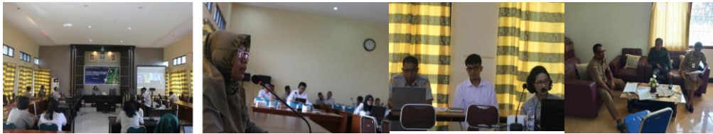
Gambar 2 : Rapat Perencanaan Seminar Proposal, Rapat Awal Tim dan Koordinasi dengan Instansi Terkait

BPSIP Maluku berupaya untuk dapat meningkatkan akuntabilitas kinerja yang dilaksanakan dengan menggunakan indikator kinerja yang meliputi efisiensi masukan (input), kualitas perencanaan dan pelaksanaan (proses) dan keluaran (output). Metode yang digunakan dalam pengukuran pencapaian kinerja sasaran adalah membandingkan antara target indikator kinerja setiap sasaran dengan realisasinya. Berdasarkan perbandingan tersebut dapat diperoleh informasi capaian kinerja setiap sasaran pada tahun 2023. Informasi ini menjadi bahan tindak lanjut untuk perbaikan perencanaan dan dimanfaatkan untuk memberi informasi kepada pihak internal dan eksternal mengenai sejauh mana pencapaian sasaran yang telah ditetapkan dalam mewujudkan tujuan, misi, dan visi BPSIP Maluku.