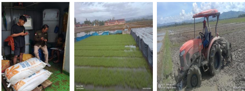
Gambar 3 : Pengiriman Benih ke Lokasi, Semai Benih, Pengolahan Lahan

BPSIP Maluku sebagai penghasil teknologi spesifik lokasi tepat guna yang terstandar secara nyata dapat diakui keunggulannya. Hal ini memberikan peluang bagi upaya peningkatan peran dan kerjasama yang semakin intensif dengan Pemerintah Daerah dan Stakeholder lainnya untuk menyamakan persepsi yang sama mengenai masa depan pembangunan pertanian dan pedesaan di provinsi Maluku.